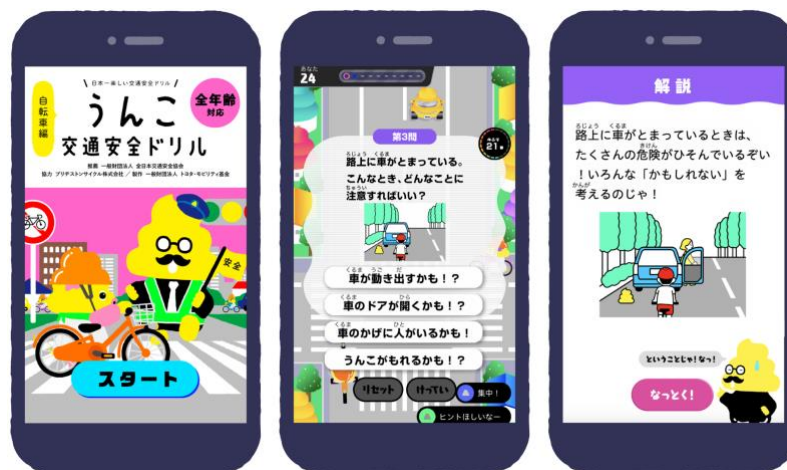
<イメージ> オンラインゲーム