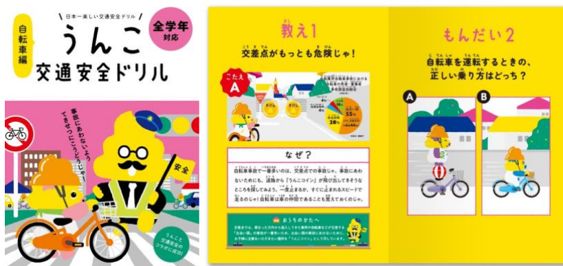
<イメージ> うんこドリル冊子(自転車編)